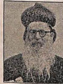
മാർത്തോമ്മാ ദിവന്നാസ്യോസ് മെത്രാപ്പോലീത്ത (പത്തനംപുരം താബോർ ദയാ)